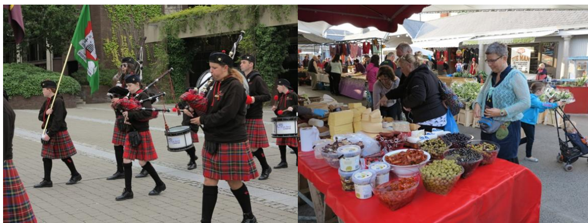
From left: 1) Entertainment at University Campus Community Day. 2) Saturday at the Milk Market, one of the oldest markets run in Ireland.

Uansett; det er først og fremst hverdagene og hverdagslivet, det vi er med på daglig eller ukentlig og de tilhørende møtene med andre som lever her, som jeg føler setter dypest spor. Enten det er på universitetet, rundt bordet på White House' poetry theatre, i badstua eller med en kaffekopp på Milk Market er de fleste interessert i oss og vårt syn på Irland, samtidig som de gjerne diskuterer samfunnsaktuelle saker om legalisering av abort, barnehagesystem, konservatisme og utfordringer med arbeidsløshet og alkohol. Hvordan de snakker om egen matkultur og oppslutning rundt (ukjente) idretter som Hurling og Gælisk fotball viser en stolthet over det lokale og «irske». Limerick er i tillegg en Rugby-by, laget 'Munster' har fungert som en katalysator mellom ulike 'klasser' i samfunnet, og på hjemmekampdager koker det i sentrumsgryta. Limerick er i bebyggelse preget av å ha vært en industriby, mindre tradisjonsromantisk enn f. eks. Galway, men kanskje nettopp derfor også mindre turistifisert. Opplevelsen av å tilhøre Limerick hverdagen er genuin. Men kanskje hadde det vært slik uansett hvor i Irland vi hadde bodd, for irene oppleves svært vennlige og, i følge husets sønn «ekstremt høflige» - han har registret at han sier «sorry» lenge før han får tenkt seg om.