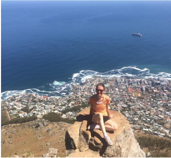
Lion's head, Sea Point i bakgrunnen.