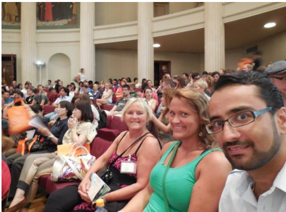
Spente deltakere på åpningsseremonien