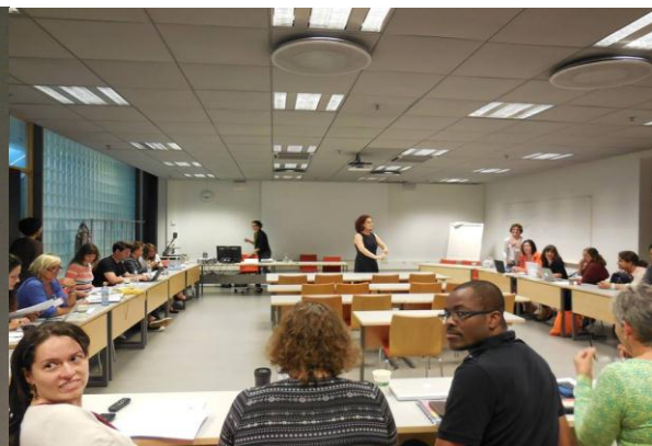
Klassen lytter til Sannino