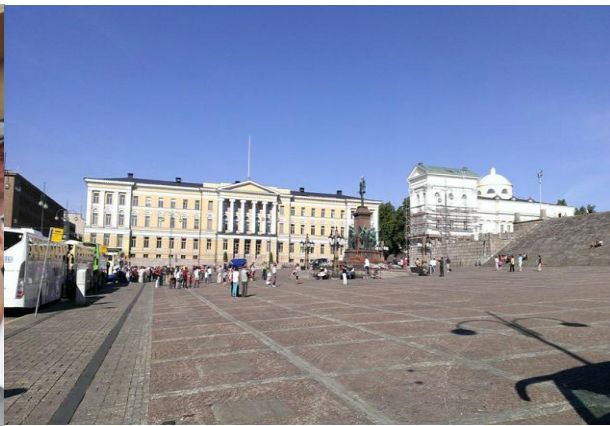
Universitetet i Helsinkis hovedbygning

Denne teorien passer som hånd i hanske for oss som driver med intervensjonsforskning. Ifølge Vygotsky må man studere fenomener i deres utvikling for å kunne forstå dem. Intervensjonsforskeren er nettopp interessert i endringer i praksis. Engeström og hans medarbeidere har bygd opp et eget forskningscenter (CRADLE) hvor aktivitetsteorien brukes i ulike intervensjoner. Fram til nå skal det være over 25 stipendiater som er uteksaminert ved senteret.